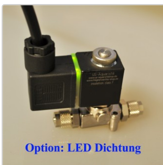
Option: LED Dichtung

CO2 Nachtabschaltung Magnetventil Aquaristik vernickelte Ausführung